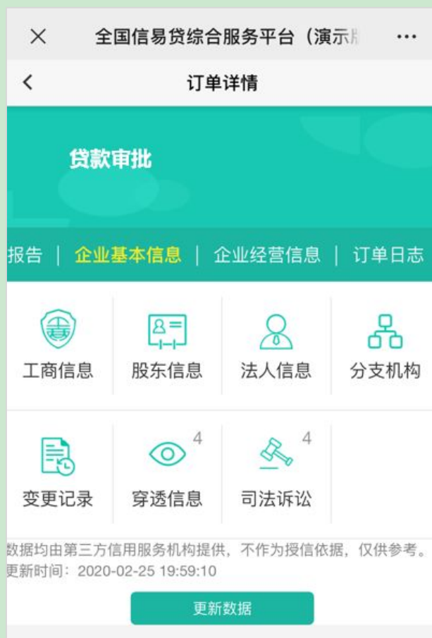
图 9-手机端企业基本信息查询

金融机构专管员可对订单进行查看、指派客户经理、撤销指派、业务回收、添加进度、查询等操作。