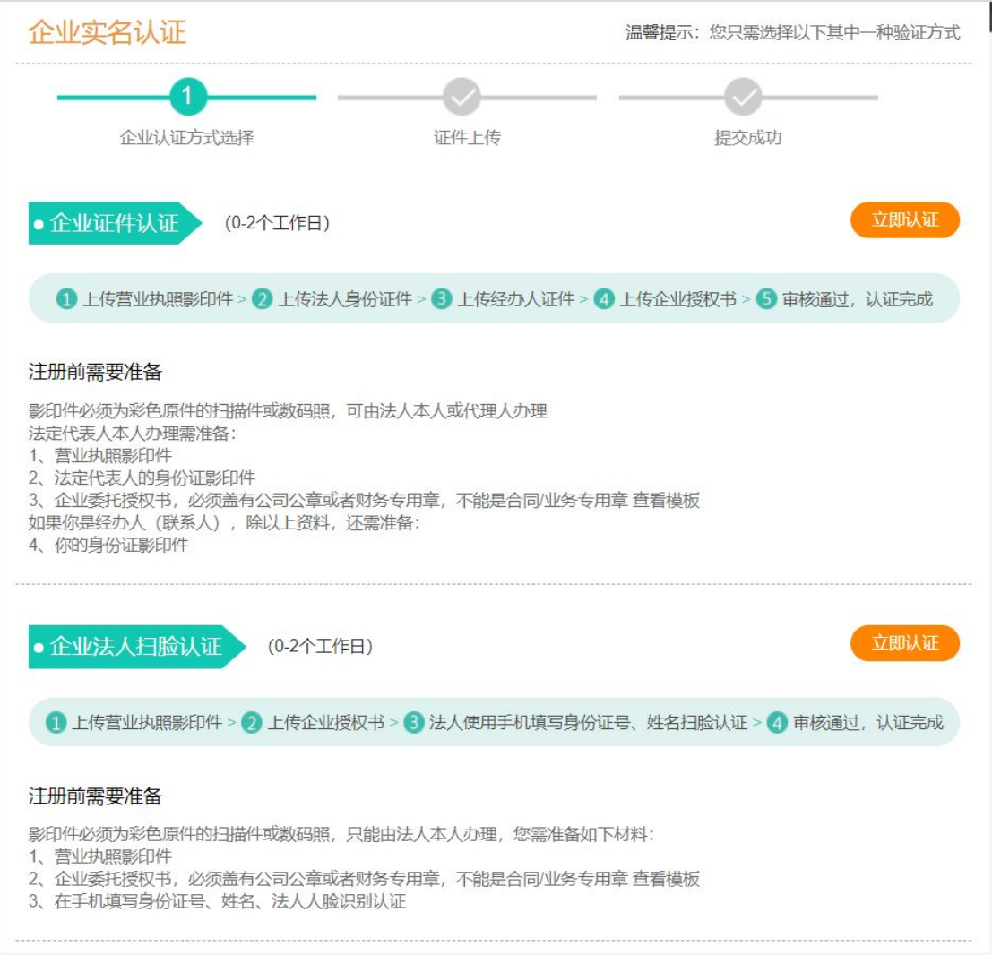
图 3-企业实名认证方式选择